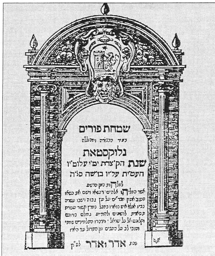
שער של מחזה פורימי שנכתב והודפס על ידי ראובן הנריקס בעיר גליקשטט בשנת 1650